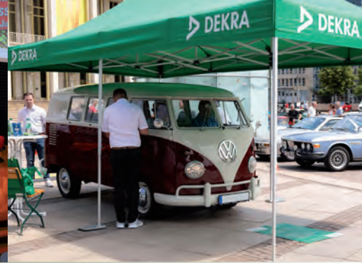
Wertvolle Preise beim Concours „WEMPE Ehrenpreis“