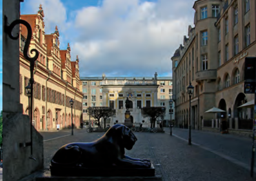
Alte Handelsbörse Leipzig hinter dem alten Rathaus