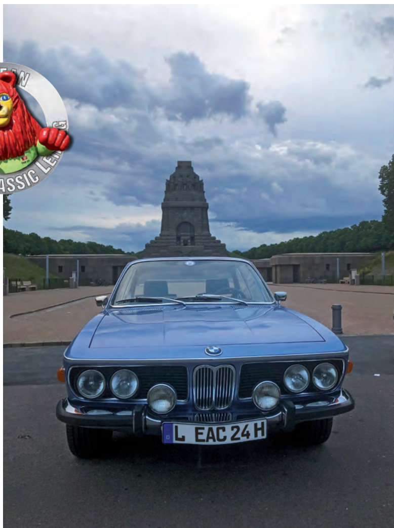
BMW 3.0 CSA, Baujahr 1972, vor dem Leipziger Völkerschlachtdenkmal

Am Donnerstag führt der Abendprolog zu kleinen, spannenden Aufgaben.