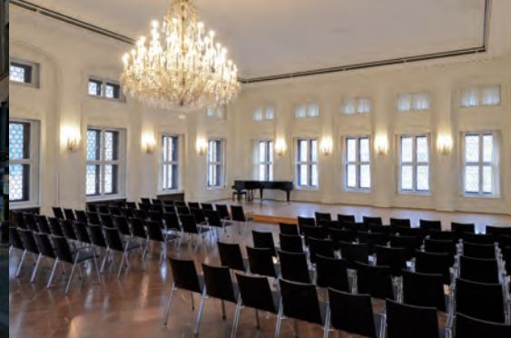
Tour-Besprechung in Leipzigs Kleinod, der Alten Börse