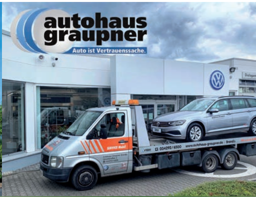
Autotransporter mit Ersatzauto vom Autohaus Graupner