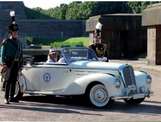
Präsentation vor dem Völkerschlachtdenkmal