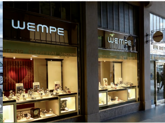
Wertvolle Preise beim Concours „WEMPE Ehrenpreis“