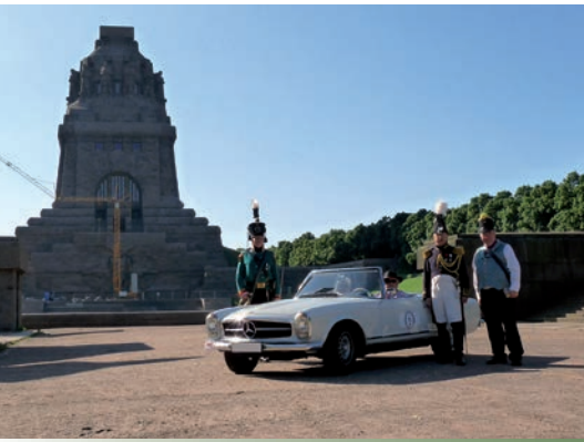
Start ist wieder am Völkerschlachtdenkmal © André Brödel