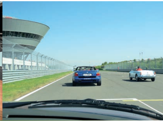
Fahrt auf der FIA-zertifizierten Porsche Teststrecke