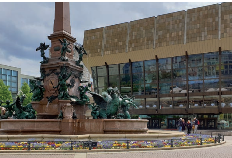
Mendebrunnen auf dem Augustusplatz