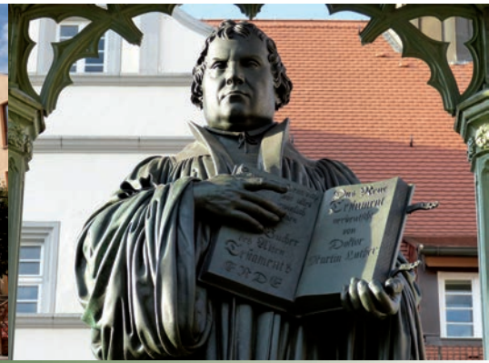
Lutherdenkmal in Wittenberg