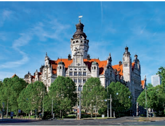
Neues Rathaus Leipzig