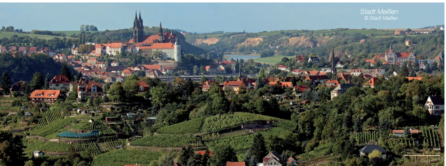
Stadt Meißen

Ihr Olaf Raschke Oberbürgermeister der Stadt Meißen