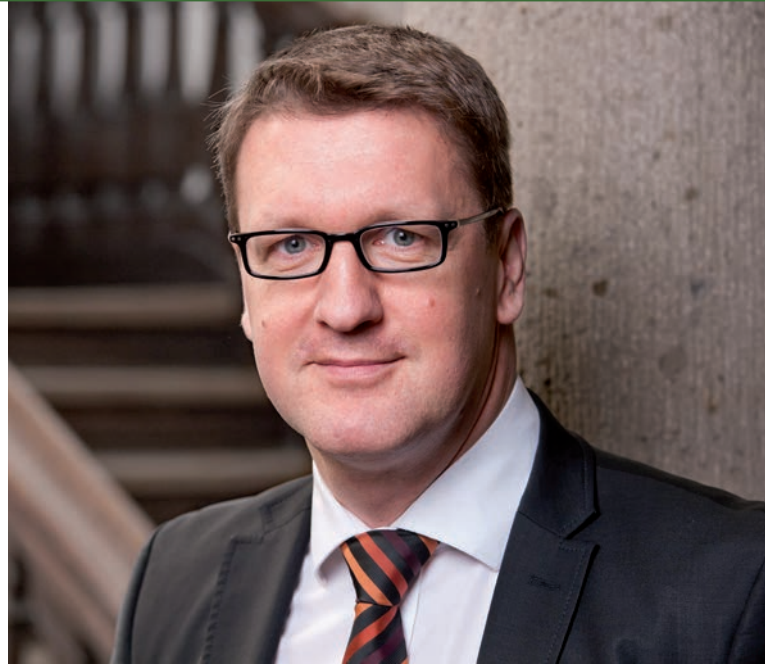
Torsten Zugehör, Oberbürgermeister der Lutherstadt Wittenberg

Die Wittenbergerinnen und Wittenberger freuen sich, wenn Sie mit Ihren bewegenden und zugleich beweglichen Klassikern am 19.06.2021 im Herzen der Lutherstadt Station machen werden. Glänzender Chrom, die Farbpracht der motorisierten Veteranen und die Aura aus Patina und Benzingesprächen versprechen eine Zeitreise mit Sympathieträgern aus Blech. Ganz gleich, ob es sich dabei um die Erinnerung an die eigene mobile Vergangenheit handelt oder sich auf Fotos und Berichte aus längst zurückliegenden Zeiten beschränkt. Umrahmt von den historischen UNESCO-Welterbestätten bieten die mobilen Zeitzeugnisse des 20. Jahrhunderts den Gästen sowie den Wittenbergerinnen und