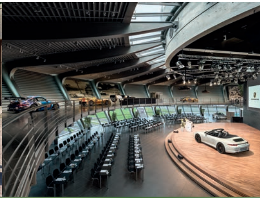
Porsche Auditorium