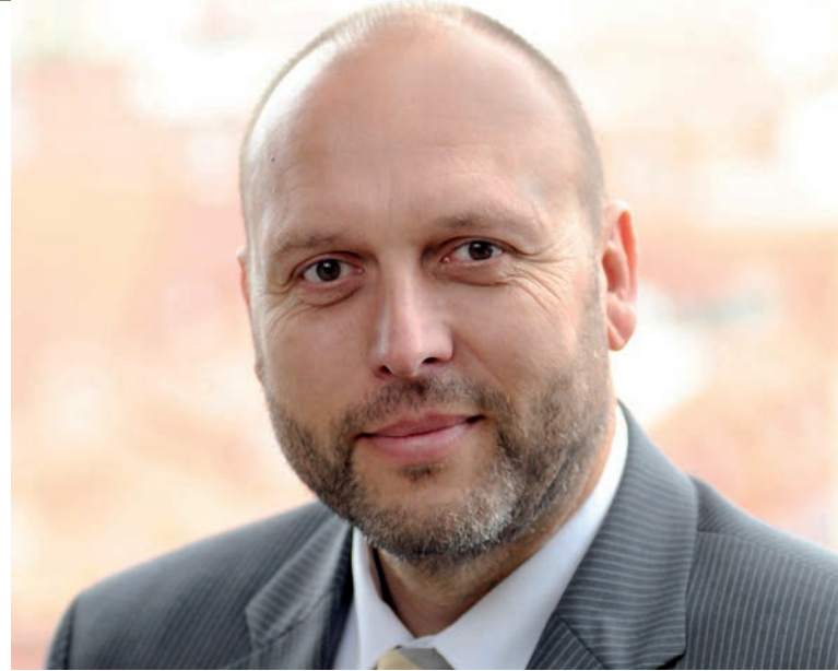
Olaf Raschke, Oberbürgermeister der Stadt Meißen

In Meißen verbindet sich die uralte Handwerks- kunst der Porzellanherstellung mit der landschaftlich reizvollen Elbland-Region. Entstanden im 15. Jahr- hundert, gilt die majestätisch auf dem Burgberg thronende Albrechtsburg nicht nur als das älteste Schloss Deutschlands, sie war auch mehr als 150 Jahre lang die Produktionsstätte des ersten europä- ischen Porzellans. Bis heute bezaubert Meißen mit einer Mischung aus eindrucksvollem historischem Erbe, pittoresken Stadtansichten, kultureller Vielfalt und landschaftlichen Reizen. Auch der Weinanbau hat hier eine lange Tradition, von der Sie sich bei den umliegenden Weingütern oder in den urigen Loka- len überzeugen können. Dort lässt sich nach einem ereignisreichen Tag gut einkehren und zum Beispiel