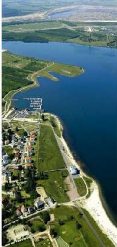
Cospudener See - „Pier 1“