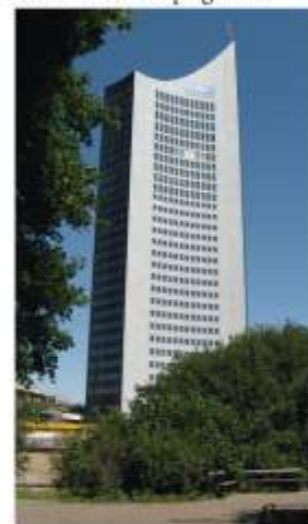
Leipzig - City Hochhaus