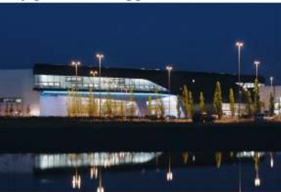
BMW Werk Leipzig