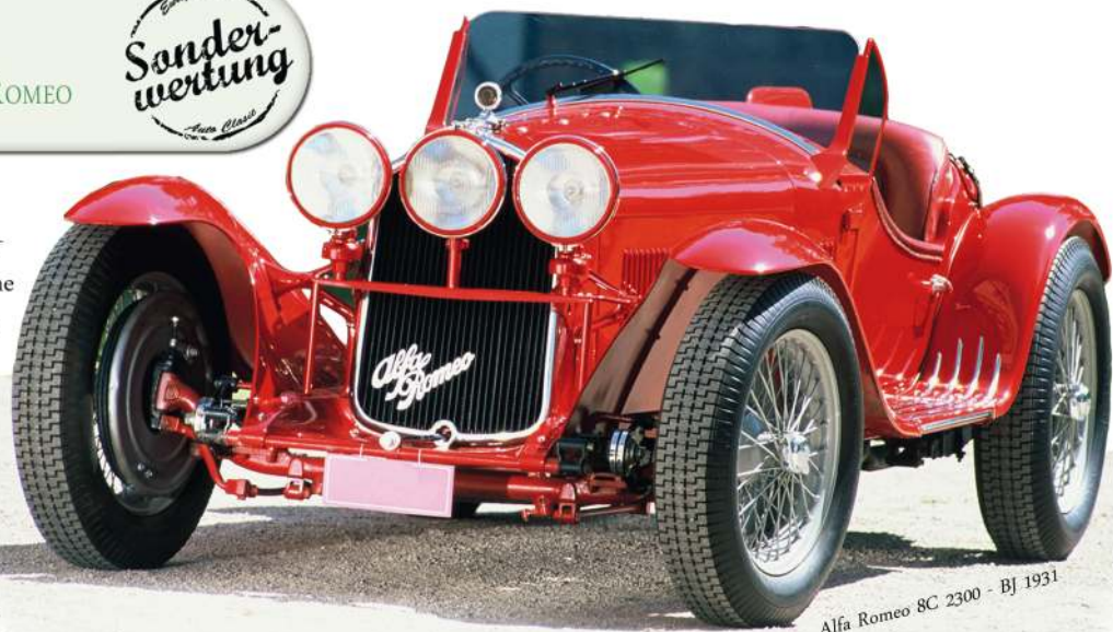
Alfa Romeo 8C 2300 - BJ 1931

die italienischen Autos in den Mittelpunkt. Natürlich freuen wir uns sehr über Klassiker aller Marken aus „aller Herren Länder“. Durch Kontaktaufnahme zu Bürgern und Institutionen in Leipzigs europäischen Partnerstädten wollen wir die Partnerschaften durch Einladung von Oldtimer-Freunden aus diesen Städten beleben und wünschen viel Spass in Leipzig! Die freiwilligen Zahlungen der Teilnehmer zusätzlich zum Nenngeld und der Erlös der Tombola stellen wir „Lions-Quest“ zur Verfügung. Wir freuen uns über Ihre Sachspende für die Tombola. Gern nennen wir Ihren oder den Namen Ihres Unternehmens auf unserer Homepage.