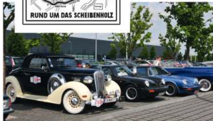
Ausfahrt zum BMW Werk Leipzig 2008

Original Fahrzeuge, die hier bei Rennen gefahren wurden, sind als Gäste herzlich willkommen.