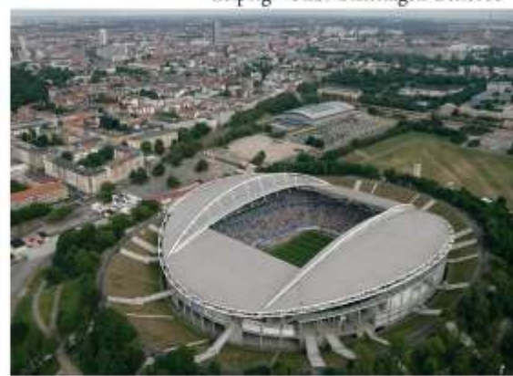
Leipzig - Zentralstadion