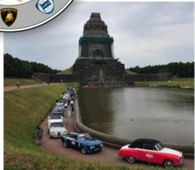
Anfahrt um das Wasserbecken am Völkerschlachtdenkmal 2008

Die Teilnahme erfolgt auf eigene Gefahr. Insbesondere sind Fahrer und Beifahrer für ihr Fahrzeug und seinen Inhalt sowie für die Einhaltung gesetzlicher und versicherungsrechtlicher Bestimmungen selbst verantwortlich. In diesem Sinne enthält auch das ausgehändigte Roadbook lediglich unverbindliche Empfehlungen. Der Veranstalter übernimmt keine Haftung für durch Teilnehmer oder Besucher angerichtete Schäden. Das Nenngeld ist Reugeld und wird nur bei Ablehnung der Nennung oder bei Absage der Veranstaltung zurück gezahlt. Das ausgeschriebene Programm entspricht dem festen Willen der Veranstalter. Änderungen oder Ausfall einzelner Inhalte müssen aber vorbehalten bleiben und begründen keinen Entschädigungsanspruch seitens der Teilnehmer. Die Veranstalter werden sich in jedem Fall um einen adäquaten Ersatz bemühen.