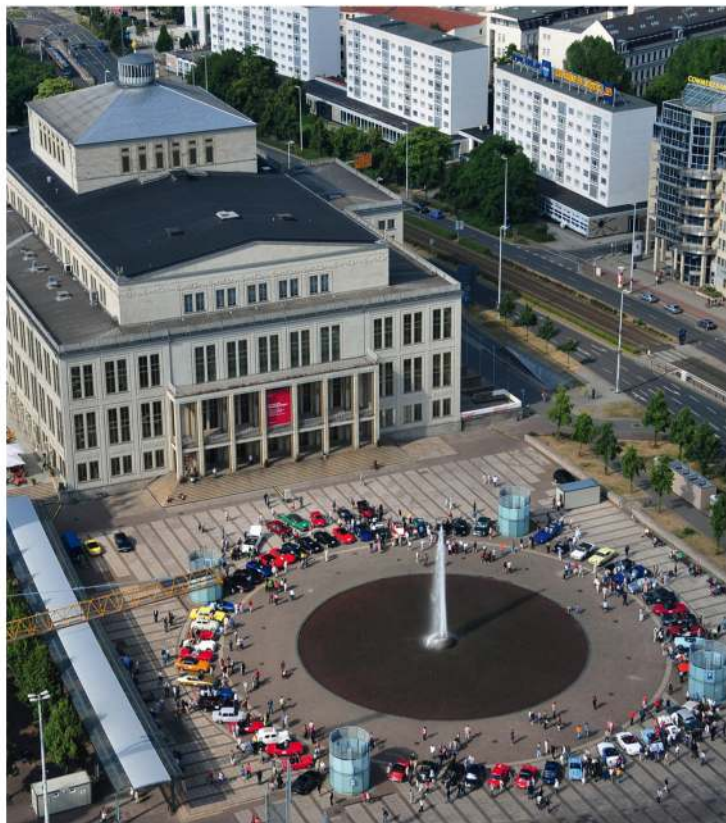
Fahrzeugpräsentation auf dem Augustusplatz vor der Oper 2008