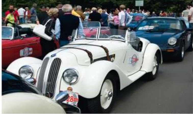
Leipzig 2008 - „Rund um das Scheibholz“