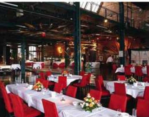
„Da Capo“ Oldtimer-Museum und Event-Halle