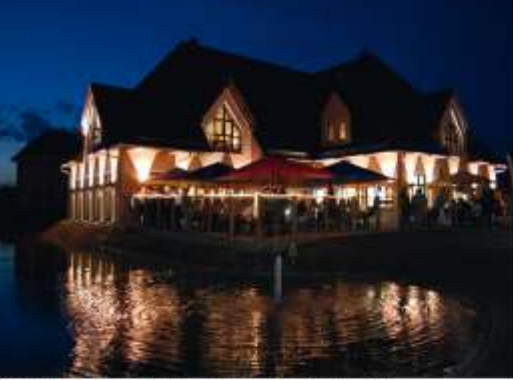
Markkleeberger See - „Seepark Auenhain“