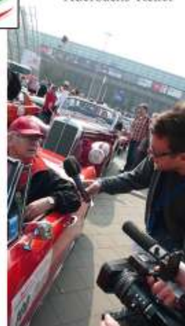
Bericht Leipziger Messe