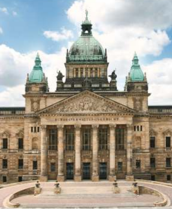
Leipzig - Bundesverwaltungsgericht