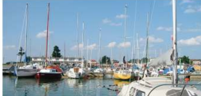
Cospudener See - Hafen