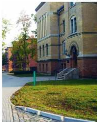
Leipzig - General Olbricht-Kaserne