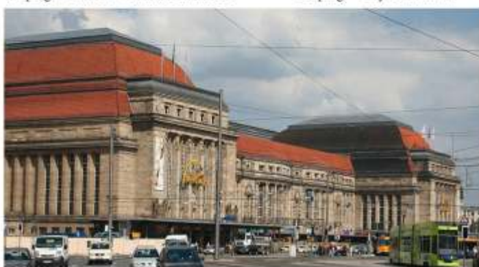
Leipzig - Hauptbahnhof