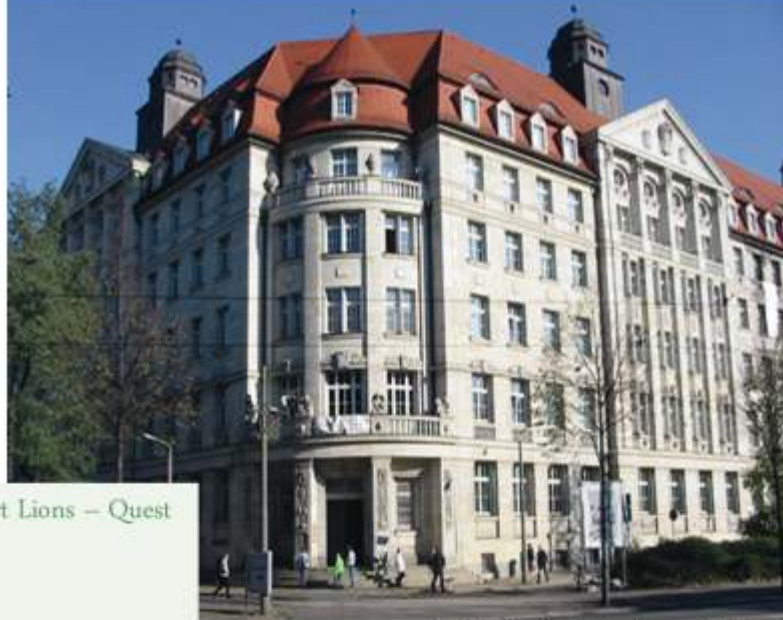
Leipzig - Stasi-Unterlagen Behörde

Grußworte des Vorstands des Hilfswerkes Deutscher Lions e.V. Ressort Lions – Quest „Erwachsen werden“ - Heinz-J. Panzner