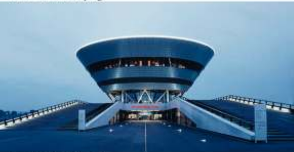
Porsche Werk Leipzig