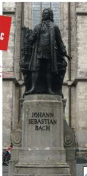
J. S. Bach-Denkmal